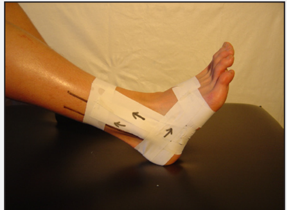
Gentages med overlap!