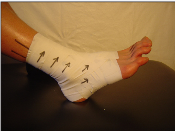
Den færdige tape set fra siden