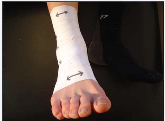
Den færdige tape set forfra