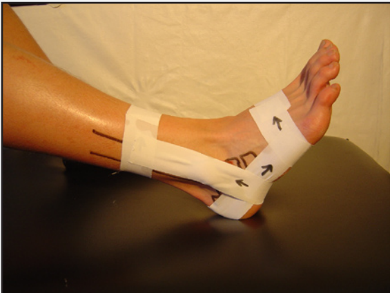
En "stigebojle" og en hestesko